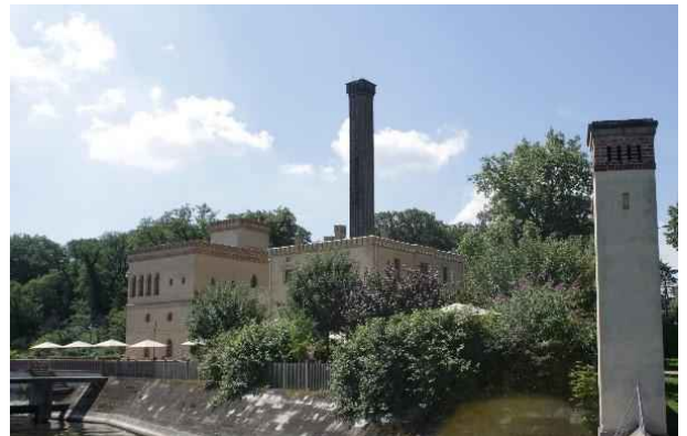
Meierei im Neuen Garten

Immer am Ufer entlang kommen wir nach Quastenhorn. Dort ist die Eremitage wieder neu entstanden (seit 2007). Von dort aus erblicken wir über den Jungfernsee schon die Meierei. Dorthin gelangen wir über den Uferweg, der zunächst am Schloß Cecilienhof und an der Grotte vorbei führt.