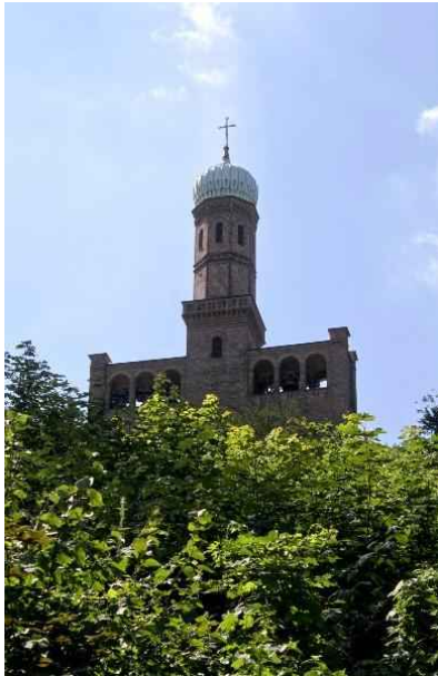
St. Peter und Paul

Noch ein Stück weiter am Ende einer Bucht kommen wir am Wirtshaus Moorlake vorbei, das von Persius erbaut wurde.