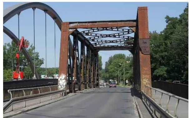
Brücke des Friedens

Der Nedlitzer Straße folgen wir nach Norden. Es ist eine Hauptverkehrsstraße, es besteht aber ein Radweg. Am Sacrow-Paretzer-Kanal kommen wir zur Brücke der Freiheit.