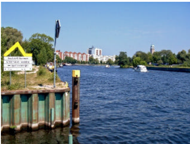
Mündung Burgwallgraben in die Havel

An der Havel angelangt, haben wir einen schönen Blick zurück zur Altstadt.