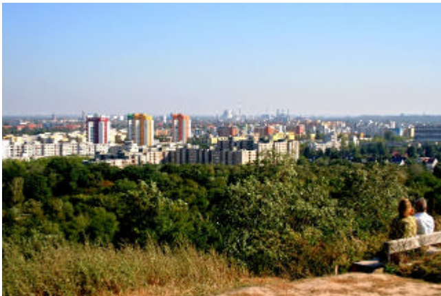
Blick auf Berlin über Rudolf-Wissell-Siedlung

Oben auf 88 m haben wir einen schönen Fernblick. Nicht nur auf das unter Bäumen verborgene Fort Hahneberg, sondern auch auf das Stadtpanorama von Berlin mit dem Teufelsberg im Grunewald, das Ruhlebener Industriegebiet wie auch die Louise-Schröder-Siedlung und Rudolf-Wissell-Siedlung. Ebenso wie auch die freie Feldflur nach Seeburg hinüber oder zum großen Klotz der Herlitz-Werke in Falkensee.