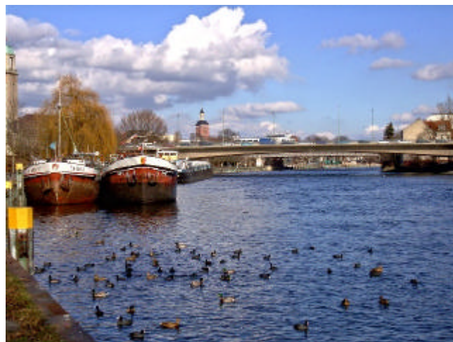
Blick zur Altstadt

Vor einem Parkplatz biegen wir nach rechts ab. Hier kommt die Straße Ziegelhof bis zu Havel. Über die Grünanlage gehen wir von der Havel weg und folgen dem Weg durch die Grünanlage nach Süden.