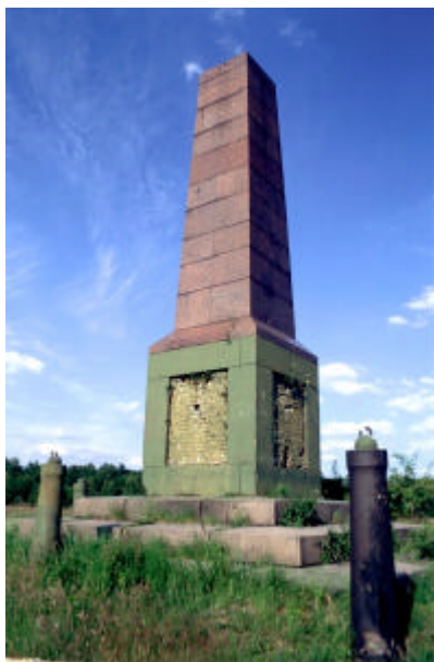
Obelisk am Hasenheider Berg

Hinter dem Einkaufszentrum Havelpark kommt der Weg heraus. Hier können wir in die Döberitzer Heide hinein.