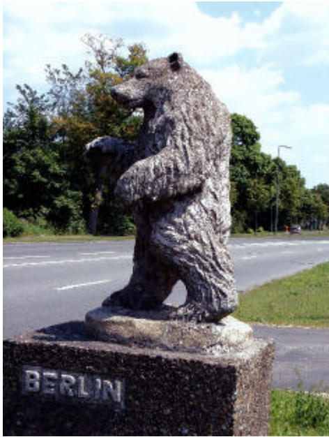
Berliner Bär an der Heerstraße

Wo die Nebenfahrbahn abbiegt (Ortsschild Dallgow-Ausbau) gehen wir weiter geradeaus auf den Radweg. Linkerhand ist ein Wald. Wir gehen querfeldein hinein, wenn eine Baumallee erkennbar wird.