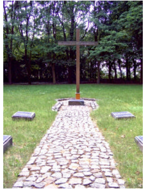
Gedenkstätte Alter Charlottenburger Friedhof

Sobald wir im Wald sind, erkennen wir, daß dies ein alter Friedhof ist. Einige Grabsteine sind noch links und rechts zu sehen und geradezu ist ein großes Kreuz erkennbar. Es ist der alte Friedhof von Charlottenburg.