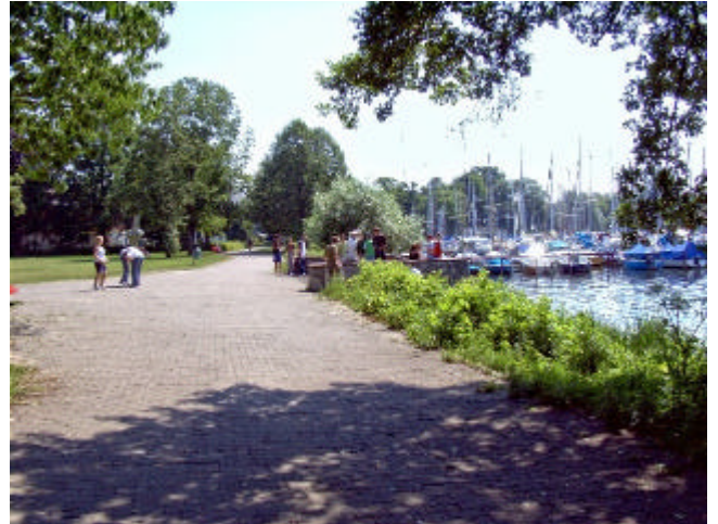
Uferpromenade Scharfe Lanke

zwei Skulpturen von Volkmar Haase: "hochwendelnd" sowie "Schild und Wehr".