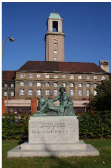
Kriegerdenkmal mit Rathaus

Start ist am Bahnhof Spandau. Vom Bahnhof gehen wir zwischen Rathaus und Bahn nach Osten bis zu Havel. Die Anlage hier (Stabholzgarten) und die Uferpromenade wurden gerade neu gestaltet.