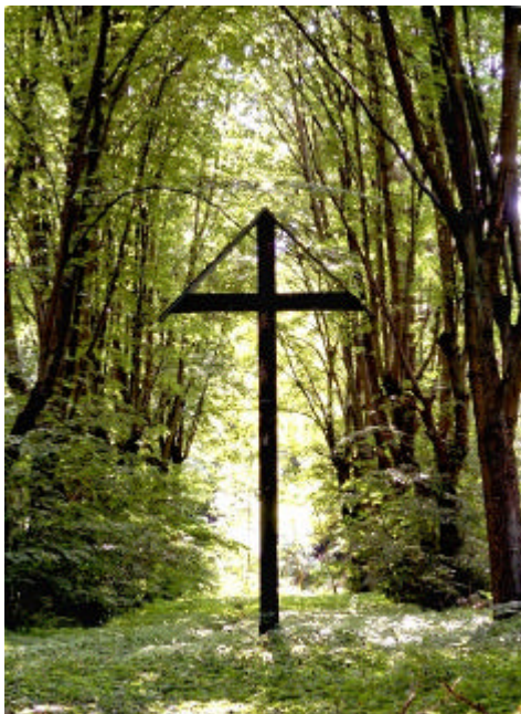
Kreuz auf Alter Charlottenburger Friedhof

Wo die Nebenfahrbahn abbiegt (Ortsschild Dallgow-Ausbau) gehen wir weiter geradeaus auf den Radweg. Linkerhand ist ein Wald. Wir gehen querfeldein hinein, wenn eine Baumallee erkennbar wird.