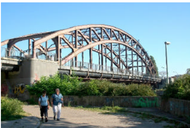
Charlottenburger Brücke (Schulenburgbrücke)

Weiter geht es der Havel folgend unter der Charlottenburger Brücke (Schulenburgbrücke) hindurch. An der Havel geht es weiter bis zur Betckestraße, hier müssen wir abzweigen und zur Götzelstraße wechseln. Dieser folgen wir dann nach Süden.