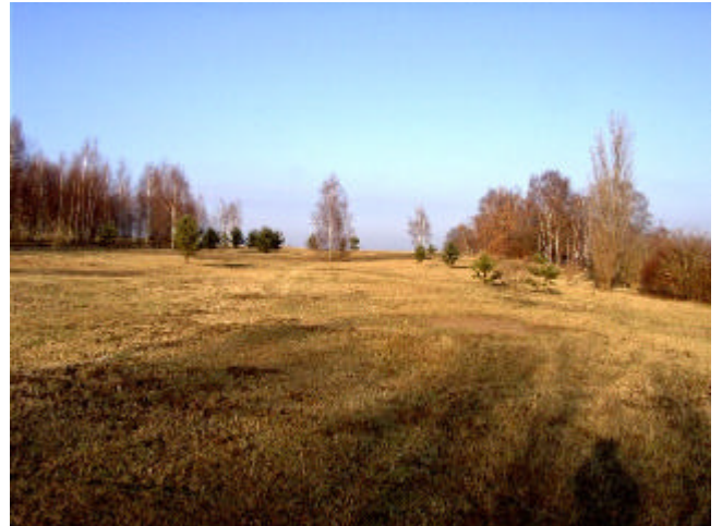
Am Hahneberg, ehemaliger Grenzstreifen

Vom Gipfel geht es dann zunächst nach Osten hinunter. Ein kleines Observatorium der Bruno-Bürgel-Sternwarte liegt links am Wegesrande. Nun wird dem gepflasterten Weg nach rechts (Westen) gefolgt. Auf dem Weg halten wir uns bei der Gabelung (Bank) links, unten dann wieder rechts auf dem Asphaltweg.