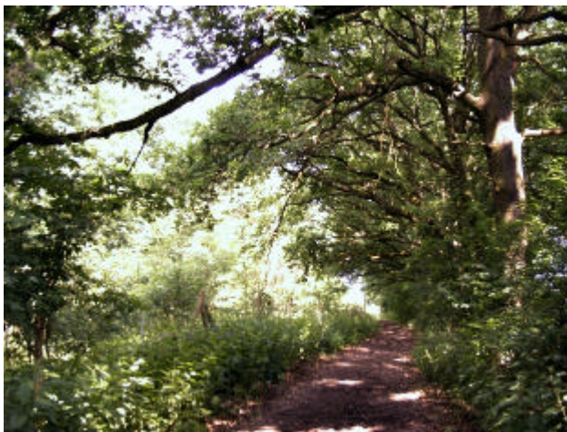
Randweg Döberitzer Heide

Hinter dem Einkaufszentrum Havelpark kommt der Weg heraus. Hier können wir in die Döberitzer Heide hinein.