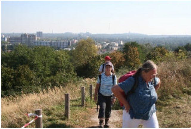
die letzten Meter zum Gipfel

Oben auf 88 m haben wir einen schönen Fernblick. Nicht nur auf das unter Bäumen verborgene Fort Hahneberg, sondern auch auf das Stadtpanorama von Berlin mit dem Teufelsberg im Grunewald, das Ruhlebener Industriegebiet wie auch die Louise-Schröder-Siedlung und Rudolf-Wissell-Siedlung. Ebenso wie auch die freie Feldflur nach Seeburg hinüber oder zum großen Klotz der Herlitz-Werke in Falkensee.