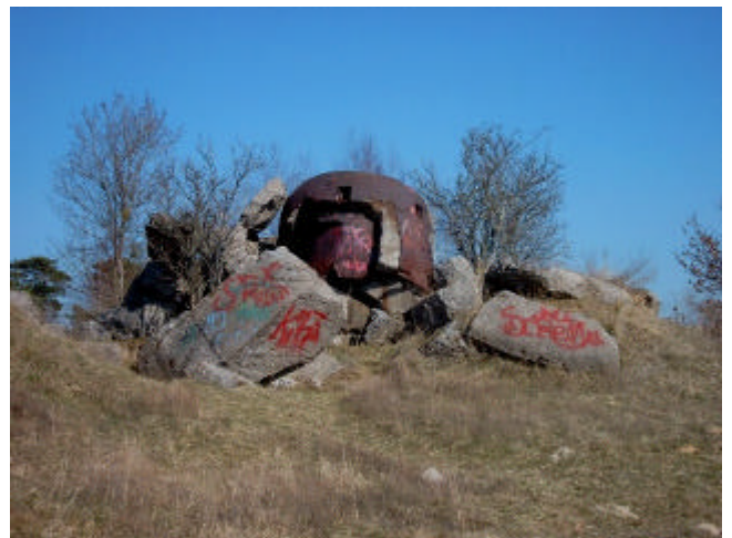
Bunker in der Döberitzer Heide

Der Obelisk wird umrundet, dann müssen wir ein Stück zurück. Die nächste Möglichkeit gehen wir nach links, um gleich darauf wieder rechts abzubiegen. An einem alten (gesprengten) Bunker kommen wir vorbei.