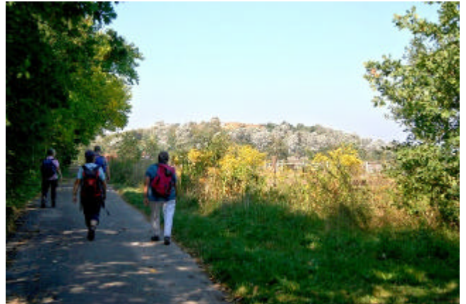
Berliner Mauerweg mit Hahneberg

Hinter den Kleingärten folgt eine Fläche mit Weiden, wo auch Pferde zu finden sind. Über diese freie Fläche blicken wir auf den vor uns liegenden Hahnebergpark.