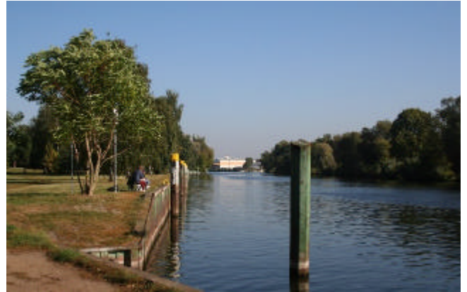
Havel Höhe Grimnitzsee

wir wieder zur Havel. Hier ist ein Liegeplatz für Binnenschiffe.