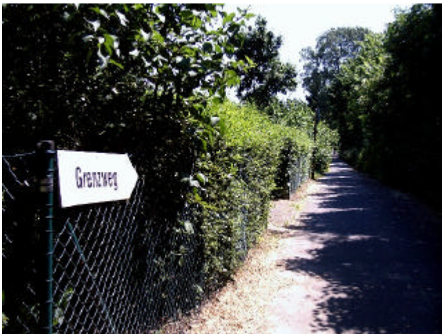
Grenzweg an der Karolinenhöhe

An der Straße geht es auf dem Rad-/Fußweg weiter nach Norden. An der nächsten Straßeneinmündung können wir die Potsdamer Chaussee verlassen. Gleich rechts gibt es einen kleinen Pfad im Wald, dem wir weiter nach Norden folgen. Nach kurzer Strecke sind wir wieder an der Straße, die nun überquert wird.