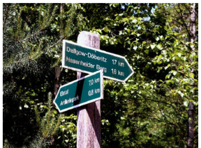
Wegweiser Döberitzer Heide

Über freie Flächen geht es weiter westwärts. Ein Weg wird gekreuzt, bei der nächsten Kreuzung erreichen wir wieder den randlichen Wanderweg (mit Wegweisern). In nicht allzu weiter Entfernung davon müssen wir nach rechts abbiegen.