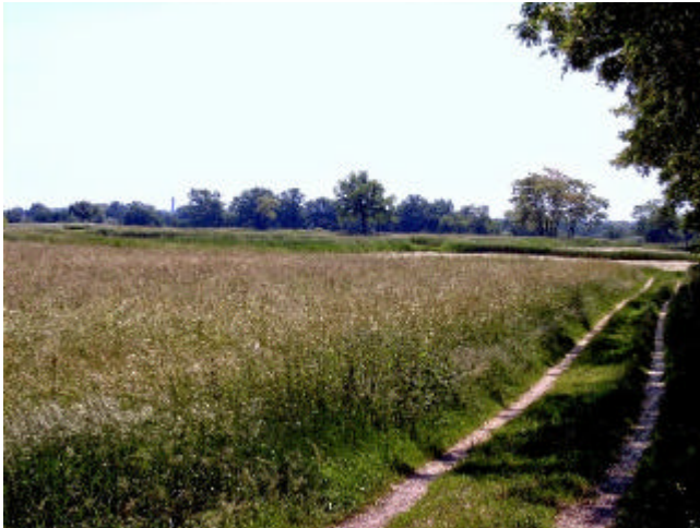
Blick über die Rieselfelder

Hier beginnen die Rieselfelder, zu denen diese Klärteiche gehören. Die Rieselfelder wurden um 1890 angelegt.