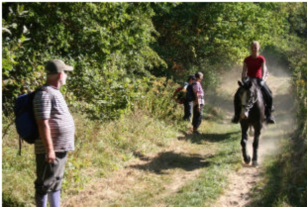
Randweg Döberitzer Heide

des Zauns. Der Weg führt im weiteren Verlauf durch Wald und bietet damit Schatten, wenn man an sonnigen Tagen im Sommer unterwegs ist.